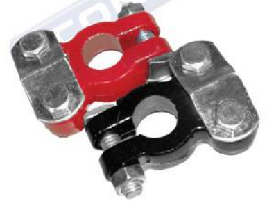
JUEGO DE BORNES DE PLOMO PARA VEHICULO PESADO