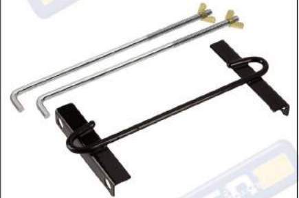
SOPORTE BATERÍA DE ACERO