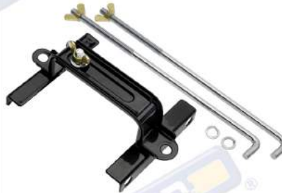
SOPORTE BATERÍA DE ACERO AJUSTABLE