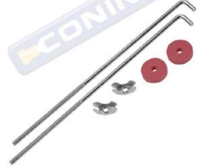
REPUESTO SOPORTE BATERÍA CON SUJETADOR Y TUERCA