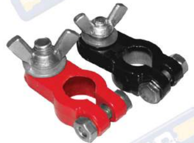
JUEGO DE BORNES DE PLOMO MARIPOSA PARA VEHICULO