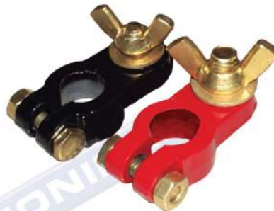
JUEGO DE BORNES DE PLOMO MARIPOSA 100% INOXIDABLE USO MARINO