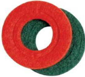
JUEGO DE AROS ANTISULFATANTES A GRANEL