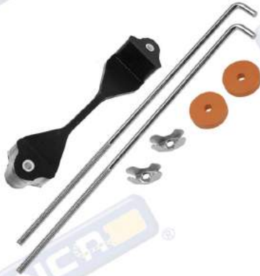
SOPORTE BATERÍA HEAVY DUTY