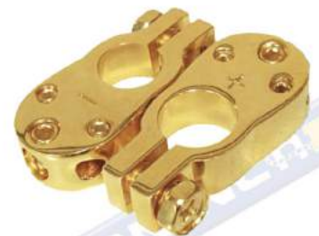
JUEGO DE BORNES DE LUJO / BRONCE PARA VEHICULO