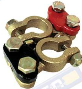
JUEGO DE BORNES DE BRONCE PARA VEHICULO PESADO