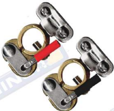
JUEGO DE BORNES DE BRONCE / AJUSTE RÁPIDO PARA VEHICULO