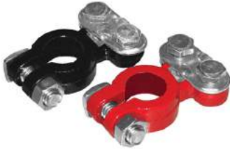
JUEGO DE MINI BORNES DE PLOMO PARA VEHICULO LIVIANO