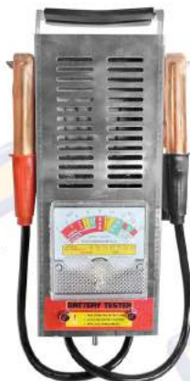
PROBADOR PARA BATERÍA AUTOMOTIZ