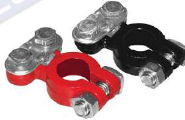
JUEGO DE BORNES DE PLOMO PARA VEHICULO LIVIANO