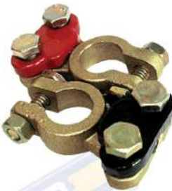
JUEGO DE BORNES DE BRONCE PARA VEHICULO LIVIANO