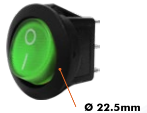
SW-118V 10 Amp - 110V / 6 Amp - 220V