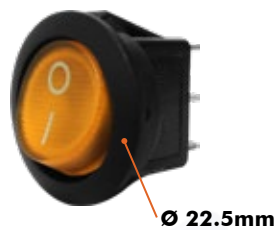
SW-118N 10 Amp - 110V / 6 Amp - 220V