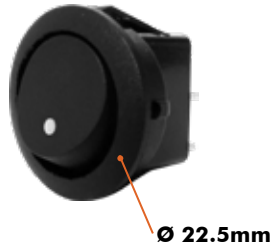
SWITCH 2 PASES Y 2 CONTACTOS 10 Amp - 110V / 6 Amp - 220V