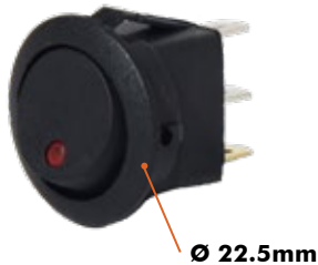
SWITCH ILUMINADO 2 PASES / 3 CONTACTOS 16 Amp / 12V