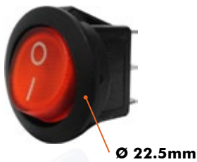
SW-118R 10 Amp - 110V / 6 Amp - 220V